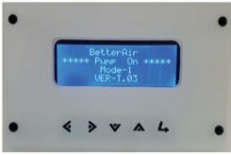
Affichage de l'appareil

Allumez l'appareil en connectant votre appareil à l'alimentation fournie. Une fois connecté, l'écran de l'appareil sera prêt pour la configuration initiale.